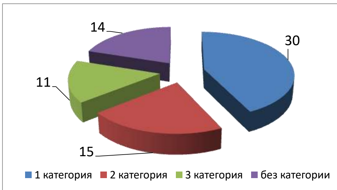
Таблица №43 - Результаты аттестации кабинетов

Результаты самообследования показывают, что состояние материально-технической базы, включая аудиторный фонд, учебно-лабораторное обеспечение, средства и формы технической и библиотечно-информационной поддержки учебного процесса, достаточно для обеспечения реализуемых направлений и специальностей. В связи с увеличением контингента, в колледже сохраняется дефицит учебных площадей.