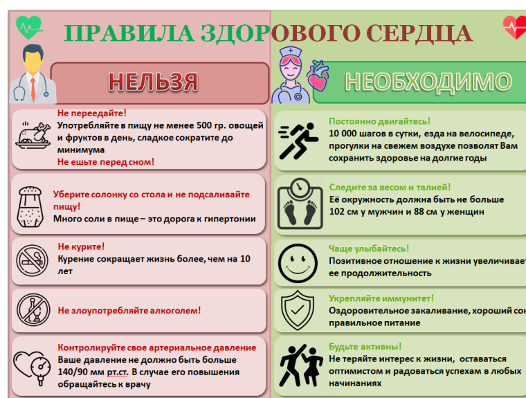
Рис. 2 – Инфографика по теме «Профилактика сердечно-сосудистых заболеваний»

Задача создателей инфографики — грамотно визуализировать информацию, чтобы не тратить «мыслетопливо».