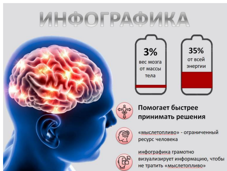
Рис. 1 Инфографика по теме «Применение инфографики в профессиональной документации»